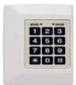
Unitate centrala de control acces si pontaj