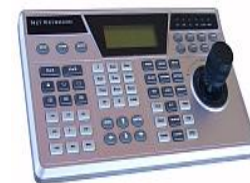
Tastatura cu joystick 3D pentru controlul camerelor speed dome