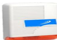
Sirena de exterior