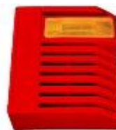
Sirena de exterior