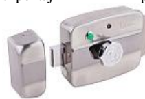
Yala cu electromotor