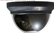
Camera video dome (dom) color de interior