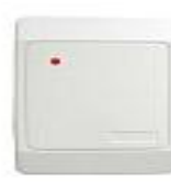
Cititor cartela proximitate