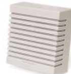
Sirena de interior