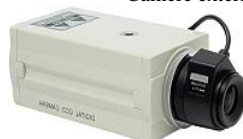
Camera video color standard de interior