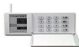
Comunicator GSM/GPRS PCS200