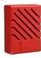
Sirena de interior