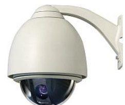
Camera video color speed dome