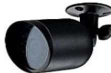
Camera exterior - IR (cu iluminator infrarosu)